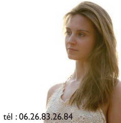
tél : 06.26.83.26.84