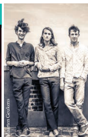
STEIGER Sélection Festival de Gent